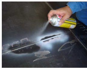
⑤現像剤を適用 (現像処理) 一定時間現像後、観察