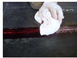
③一定時間浸透後、乾いた ウエスで除去 (除去処理)