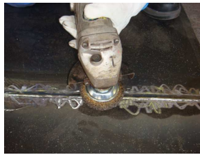
①表面及びきず内部の 汚れを除去 (前処理)