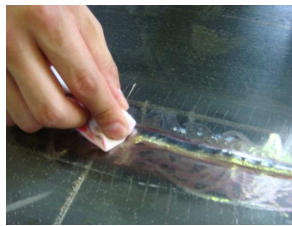
④洗浄液を含ませたウエス で浸透液を除去 (除去処理)